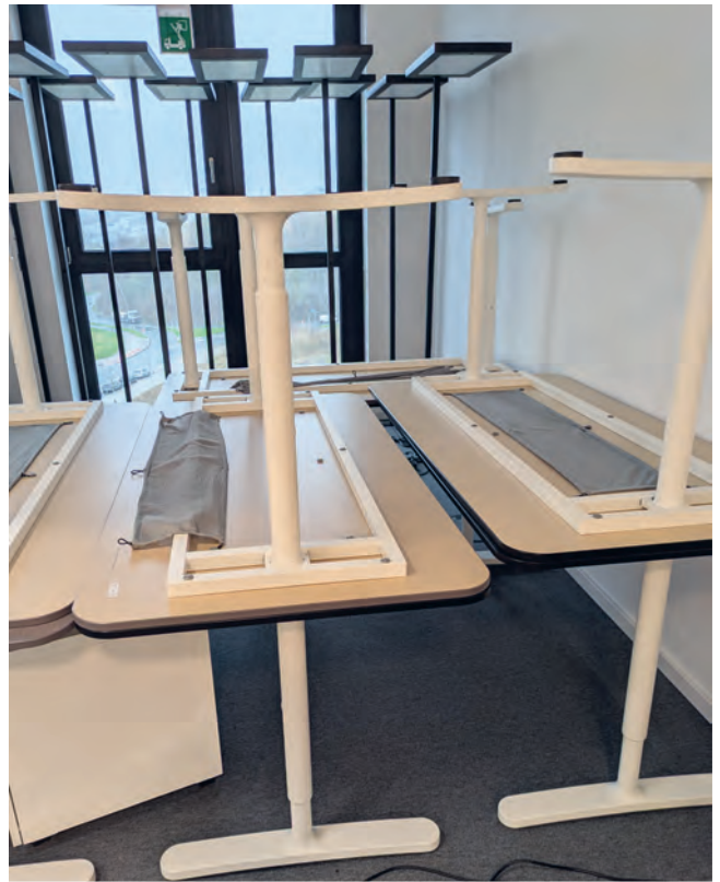
Von der Sammelunterkunft in eigenen Wohnungen: Da war auch tatkräftige Unterstützung gefragt.